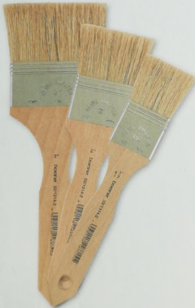
Abb. in Originalgröße