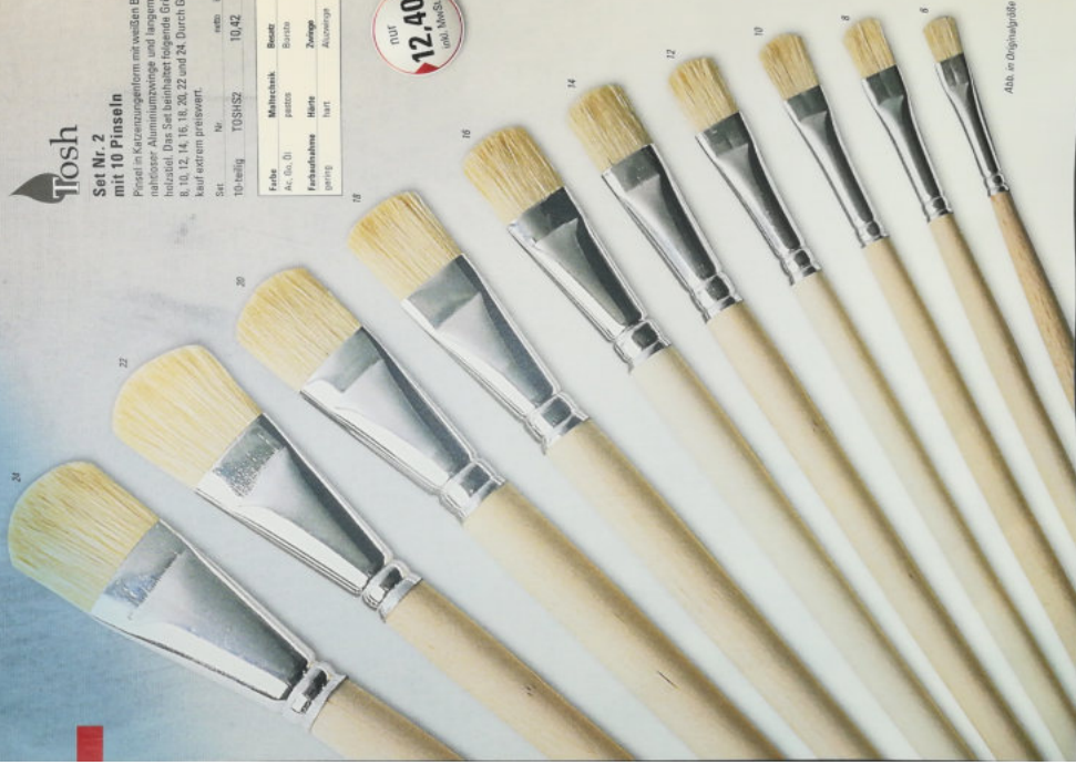
Abb. in Originalgröße