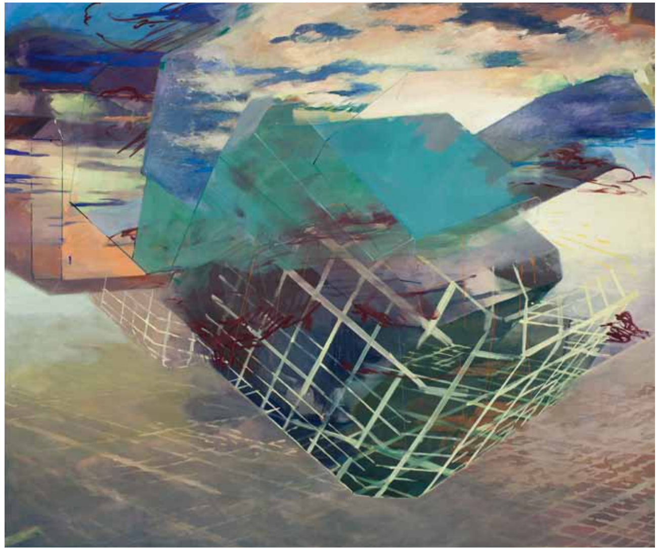
NeXt 3 , 2009, Acryl, Eitempera auf Nessel