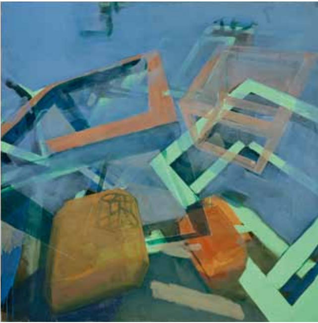
Sphincter, 2003, Acryl auf Nessel

Der Kubus gehört zur Familie der platonischen Körper, die seit dem Altertum aufgrund ihrer symmetrischen Form faszinieren. Auch der Maler Christoph Kern ist geradezu obsessiv von der Schönheit des Kubus begeistert. Er portraitiert diesen platonischen Körper auf vielfältige Weise als offene Struktur oder kompaktes Volumen. Gleich einem Würfel wirft Kern diese Form in die Weite der Bildfläche und lässt sie dann in der imaginären Tiefe des Bildraumes zum Halten kommen.