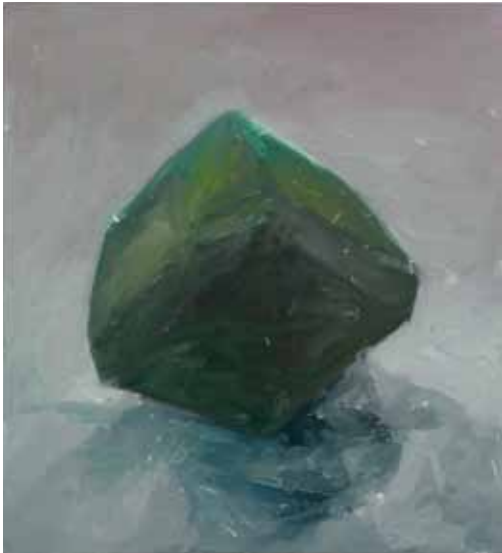
MonoT , 2002, Eitempera auf Nessel/Holz